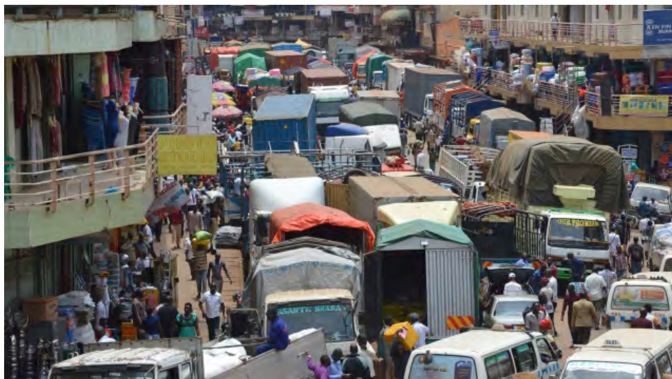
Arua Park, Kampala

La nécessité d'approvisionner en produits vivriers le Soudan du Sud et particulièrement ses villes, Juba et dans une moindre mesure Yei, Rumbek ou Torit, contribue à la constitution de bassins de production de vivrier marchand et à l'intégration de paysanneries plus ou moins fragiles à un espace transnational. C'est le cas, comme de nombreuses montagnes est-africaines, du mont Elgon qui concentre de nombreuses ressources : population, terres riches, eau abondante, dont la combinaison permet une agriculture performante. Néanmoins, il fait aussi face à des blocages structurels : parcellisation extrême du foncier, finitude de la terre et entassement de la population avec des densités rurales pouvant atteindre les 1 000 hab./km 2 (François, 2006). « L'intégration ancienne des économies locales aux courants d'échanges régionaux, nationaux et internationaux ne semble pas avoir été affectée par l'entrée en récession des systèmes de production montagnards. L'apparition des pénuries agricoles saisonnières sur les terroirs d'altitude n'a pas pour autant produit un repli sur le vivrier ni la fermeture des campagnes sur l'extérieur. C'est sans doute là l'un des grands paradoxes à souligner » (François, 2006, p.1). Le mont Elgon bénéficie d'avantages comparatifs grâce à la variété des zones agro-écologiques (altitudes, versants) qui permet son intégration au marché tout au long de l'année.