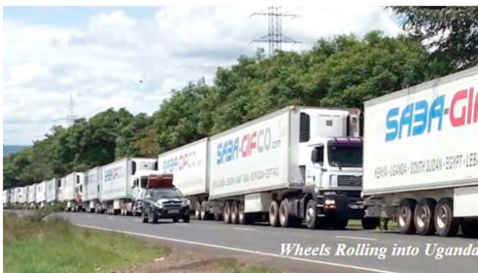
La guerre ne signifie pas la fin des affaires pour tout le monde : que transportent ces camions frigorifiques croisés sur la route du Sud-Soudan le 9 octobre 2016 ?

Le 9 octobre 2016, en route vers Kampala depuis Lira, nous avons croisé un convoi d'une dizaine de camions frigorifiques aux couleurs de la compagnie SABA GIFCO, spécialisée dans les destinations suivantes : Kenya, Ouganda, Soudan du Sud, Égypte, Liban, Koweït, Dubaï, Irak, Jordanie. Que viennent faire là ces camions qui, à eux seuls, valent des fortunes ? Que transportent-ils ? Nous n'avons pas eu la possibilité de creuser. Il est cependant probable que l'intérêt pour la région de tels acteurs habitués des marchés logistiques à risque comme des zones grises et leurs marges ne repose pas sur des décisions prises à la légère. Nous doutons que la seule perspective d'exporter de la viande sud-soudanaise d'une qualité sanitaire douteuse puisse expliquer la présence de ces véhicules.