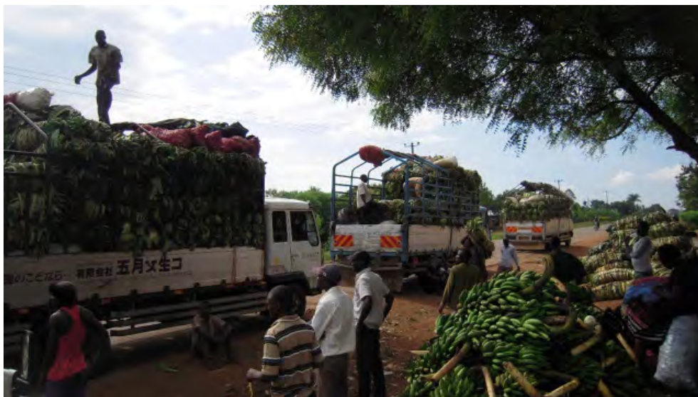
Juba Park, Mbale

Depuis l'Ouganda, le coût du transport a fortement augmenté , traduisant une conjonction de plusieurs facteurs : raréfaction de l'offre logistique vers les zones d'insécurité et augmentation du risque pris par les transporteurs (alors qu'avant la guerre civile sud-soudanaise, le coût de la location d'un camion Fuso depuis Mbale était de 2 millions US$, il atteint aujourd'hui 2,5 millions US$). En retour, cette augmentation limite le nombre des prétendants aux embarquements, restreignant plus encore le commerce vers le Soudan du Sud aux plus gros acteurs, seuls capables de mobiliser les fonds nécessaires à la prise de risque. On assiste donc à un ré-enclavement du Soudan du Sud et à une accentuation des inégalités face aux risques.